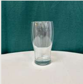
Verre à bière