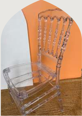
Chaise Napoléon Transparente