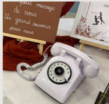
Livres d'or audio blanc