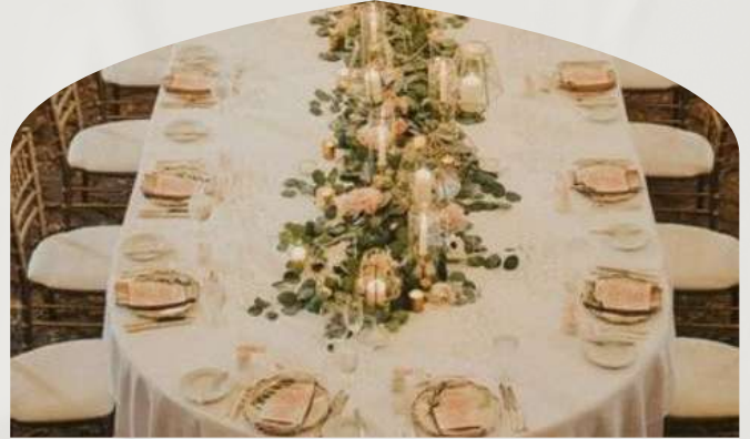
Table ovale (360 cm) 10/14 personnes