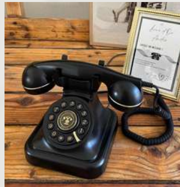
Livres d'or audio noir