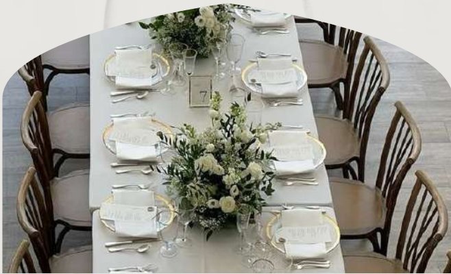
Table rectangle (180 cm) 8/10 personnes