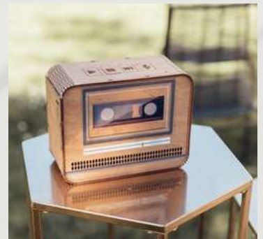
Livres d'or audio cassette