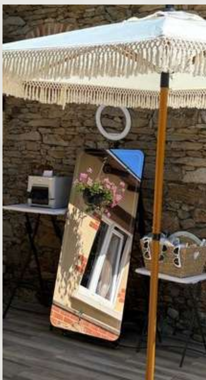
Grand miroir ( 70 pouces )