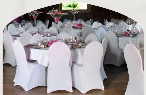
Housse de Chaise Blanche