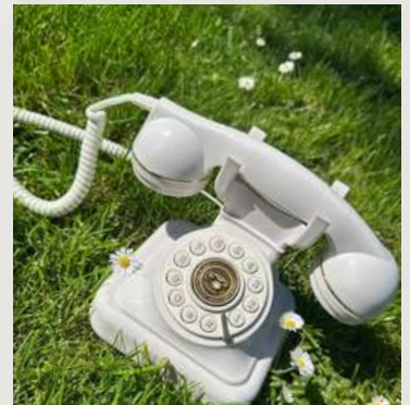
Livres d'or audio blanc & or