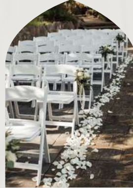
Chaise Pliante Blanche