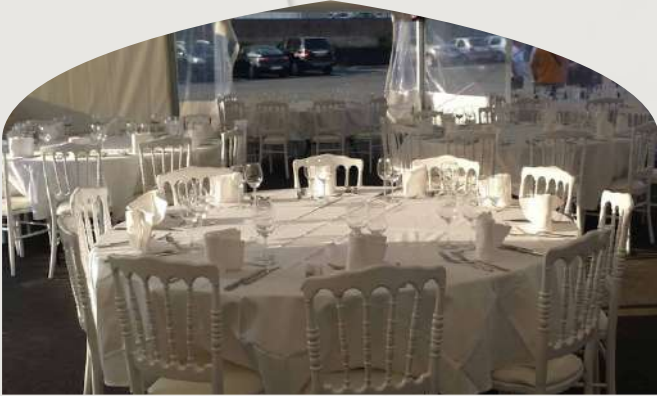
Table ronde (180 cm) 8/10 personnes