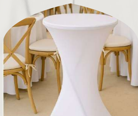
Mange debout ( 80 cm )