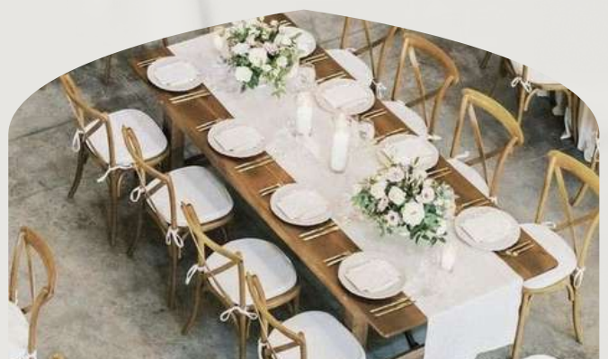
Table rectangle (150 cm)