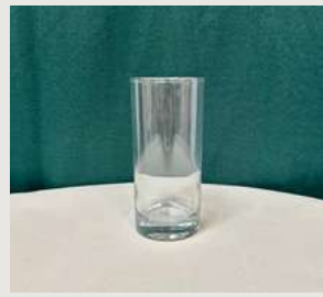
Verre à jus