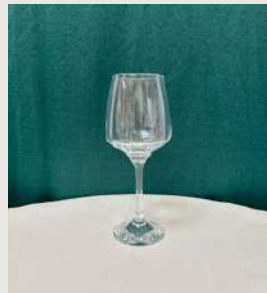
Verre à eau