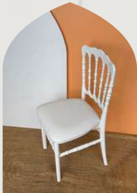
Chaise Napoléon Blanche