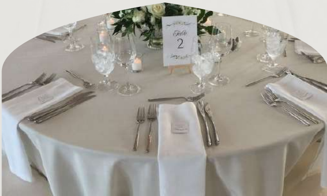
Table ronde (150 cm)