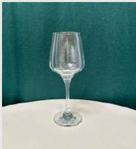
Verre à vin