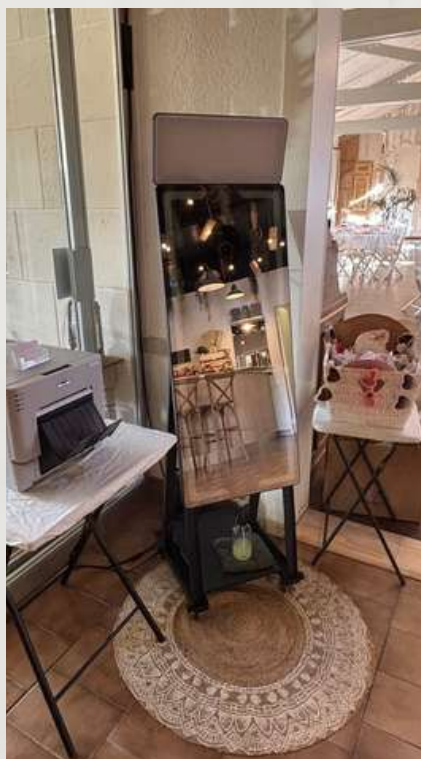
Petit miroir ( 45 pouces )

Une dose d'amour, un soupçon de fun, et des souvenirs par milliers !