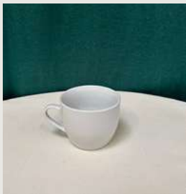
Tasse à café