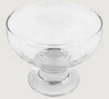
Coupe à glace