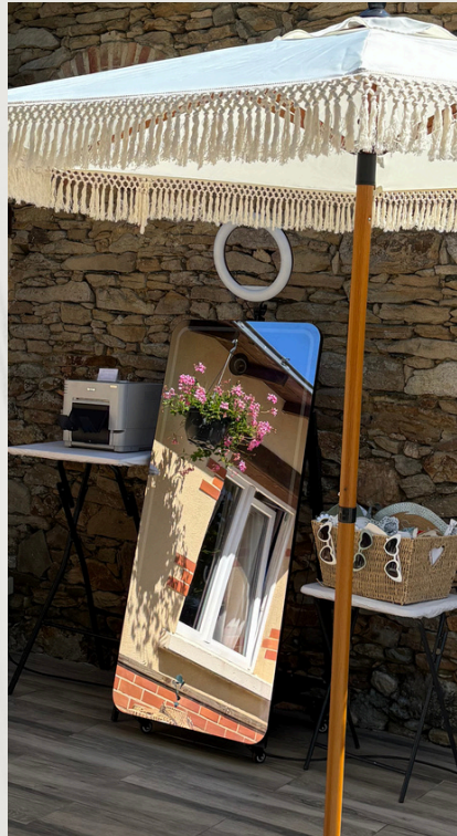
Grand miroir ( 70 pouces )