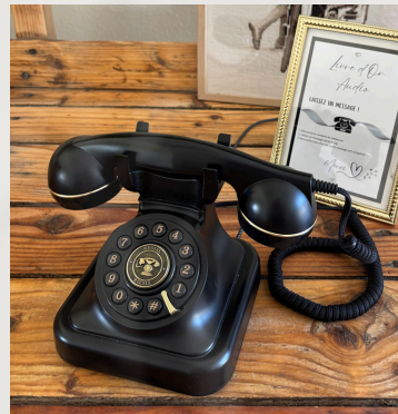
Livre d'or audio noir