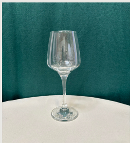
Verre à vin