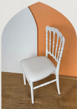
Chaise Napoléon Blanche