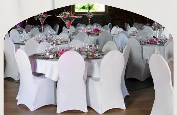
Housse de Chaise Blanche