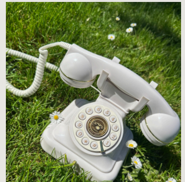
Livre d'or audio blanc & or