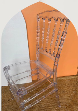
Chaise Napoléon Transparente