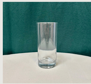
Verre à jus