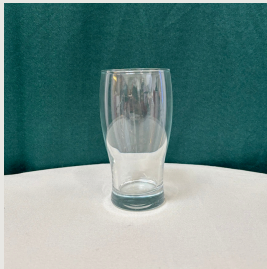
Verre à bière