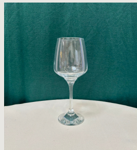
Verre à eau