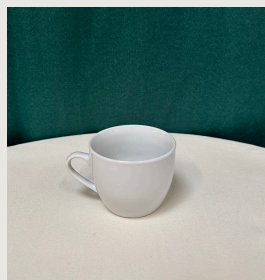
Tasse à café