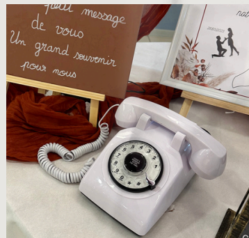
Livre d'or audio blanc