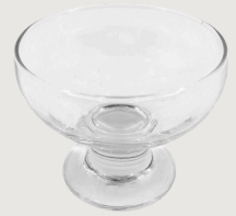
Coupe à glace