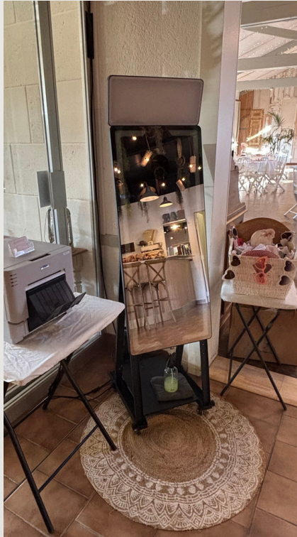
Petit miroir ( 45 pouces )

Une dose d'amour, un soupçon de fun, et des souvenirs par milliers !