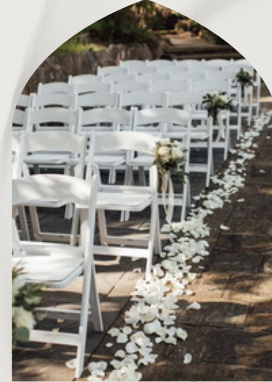
Chaise Pliante Blanche