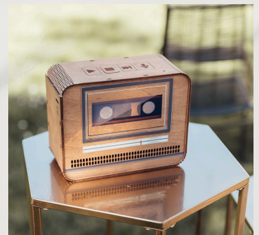
Livre d'or audio cassette

Pas besoin de stylo, juste un brin de bonne humeur et ton plus joli message à laisser. Une déclaration pleine d'amour, un souvenir drôle ou un mot qui vient du cœur !